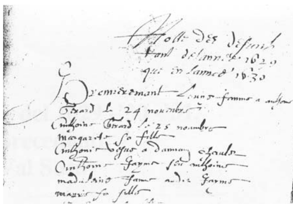
Fig. 2. Frontespizio delle: Nocte des defunts tant de l'année 1629 que en l'année 1630 .

Posso tuttavia completare il triste elenco dei morti salbertrandesi per causa della peste grazie al ritrovamento, nell'archivio comunale, di un consunto mazzo di fogli cuciti tra loro, avente per titolo: Nocte des defunts tant de l'année 1629 que en l'année 1630 . I nominativi sono raggruppati per giorno fino al 1° settembre 1630; da questa data in poi sono ancora registrati trecentosettanta defunti.