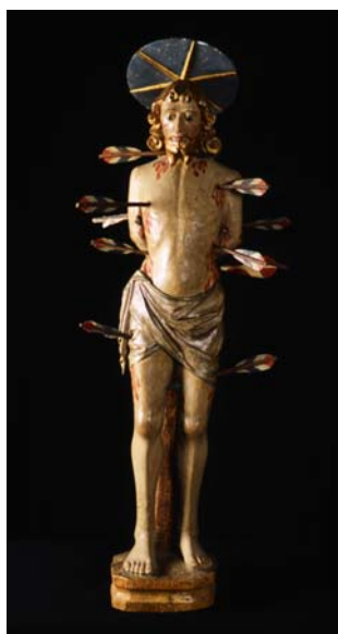
Fig. 1. Maestro Madonna di Savoulx, San Sebastiano , 1475 c.a., Museo di Arte Religiosa Alpina di Melezet (dalla cappella di S. Sebastiano a Melezet).

quali si è prevalentemente basata la nostra ricerca, datano a partire dalla fine del Cinquecento, consentendo un'indagine scientificamente attendibile solo da quella data in avanti. Anche gli archivi comunali, purtroppo, solo raramente conservano documentazione antica, che tra l'altro risulta alquanto frammentaria.