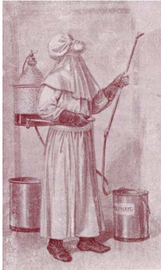
Fig. 6. Tuta indossata la disinfestazione, «Scena Illustrata», n. 17-18, 1916.