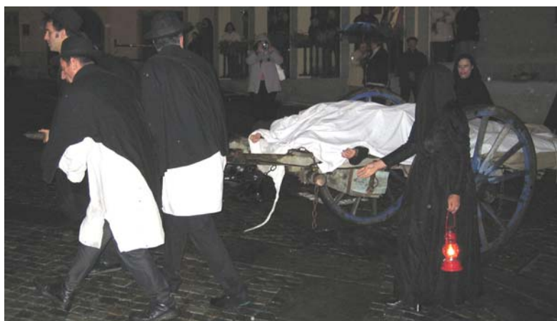
Fig. 10. Il corteo funebre abbandona la piazza (Salbertrand 2005),

A peste, fame et bello. Libera nos Domine. 17