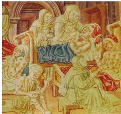
Fig. 7. Miniatura tratta da La Franceschina codice del XV sec., Perugia, Biblioteca Comunale Augusta. Mostra alcuni frati che si prodigano nelle cure degli appestati.

È un episodio fortemente evocativo: sottintende l'atmosfera ben descritta nelle cronache dell'epoca in cui le condizioni urbane in grave crisi di sussistenza, denunciano un inquinamento dovuto ai liquami escrementizi stagnanti per le strade, fogne a cielo aperto, esalanti mefitici vapori... è questa la situazione "ideale" per la diffusione dei vapori pestilenziali, è di comune credenza che il "soffio pestifero e mortale" esca ed entri attraverso le vie respiratorie, permeando anche i pori della pelle. L'inquietante presenza dei due medici, asetticamente impaludati nelle nere tuniche da cui emergono soltanto le bianche maschere a becco è ulteriormente