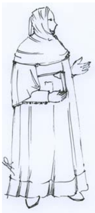
Fig. 1. Disegno da: Ritratto a penna del Boccaccio , 1341, Biblioteca Nazionale di Firenze.

Per i personaggi dei medici, invece, di particolare interesse è il confronto con l'immagine del “ritratto a penna del Boccaccio”, databile 1341, conservato presso la Biblioteca Nazionale di Firenze, di cui ripropongo una fedele riproduzione, poiché il costume maschile del Trecento è stato lo spunto storico, opportunamente semplificato, su cui si sono realizzate le tuniche indossate dai personaggi dei medici.