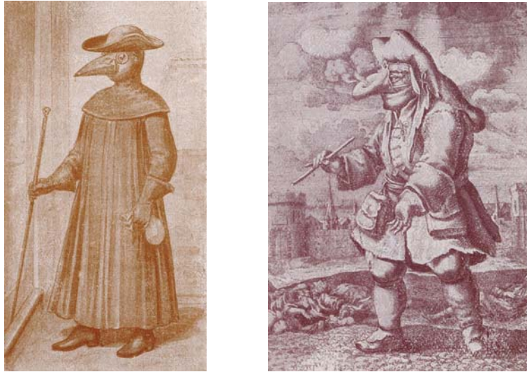
Figg. 3 – 4 . Abito di medico e maschera protettiva dal contatto con gli appestati XVII e XVIII sec., «Scena Illustrata», n. 17-18 del 1916.

Si tratteggia quindi la figura del medico del Trecento, impaludato in lunghe e sontuose vesti e, con qualche accenno satirico, si indugia sulle pratiche di cui si occupa: esami dell'orina, scelta dell'ora e giorno più adatto alla pratica dei salassi... «portava strane vesti che tutto lo ricoprivano, con lunghi guanti» ed era solito annusare «una spugna imbevuta di aceto nel quale era stata sciolta della polvere di garofano e cannella» 9 .