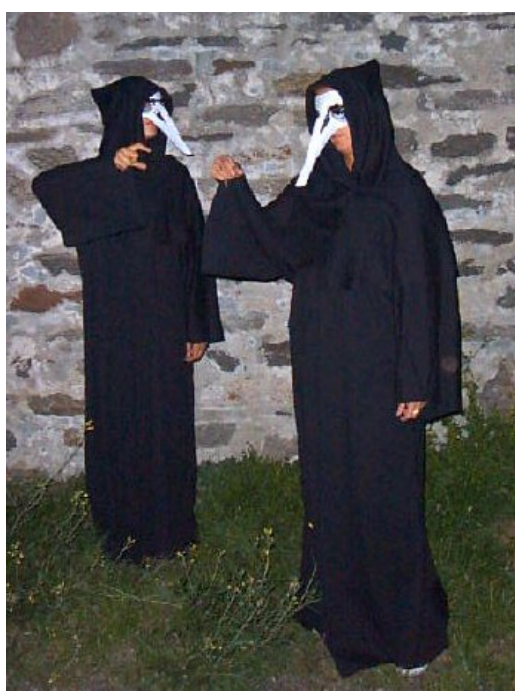
Fig. 5. I medici nello spettacolo L'angelo della peste (Salbertrand 2005).