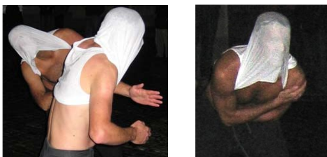
Figg. 8 - 9. I Batù ne L'angelo della peste , fotografie Ferruccio Castelli.

I personaggi maschili abbandonano le loro bianche camicie a terra, mentre nascondono il volto sotto il tessuto teso della maglia bianca che ne deforma l'espressione.